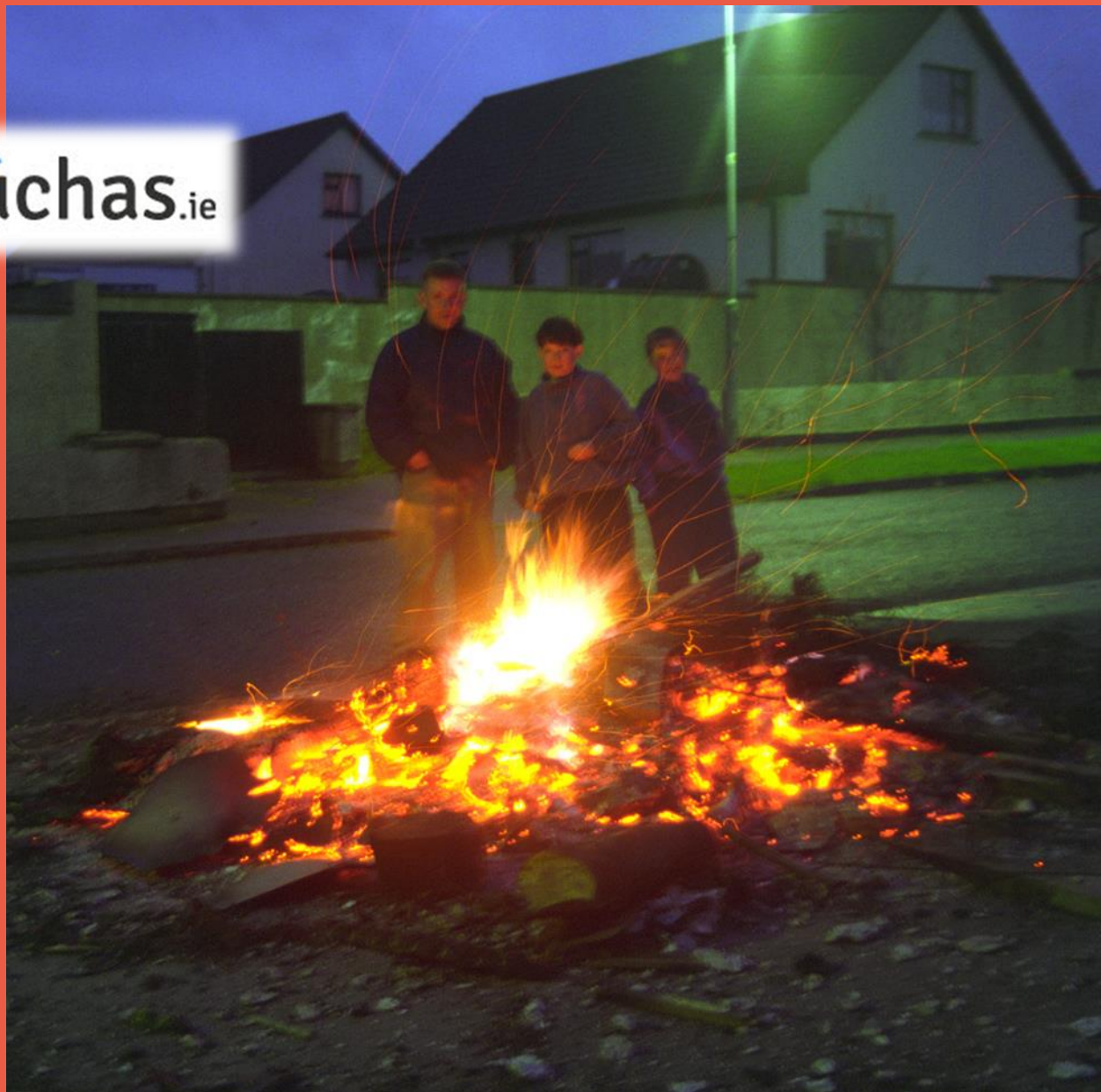
Tinte cnámh san iarnóin ar Lá Bealtaine, Baile Shligigh (Bairbre Ní Fhloinn 1995)